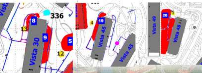
Karper, loc. 8